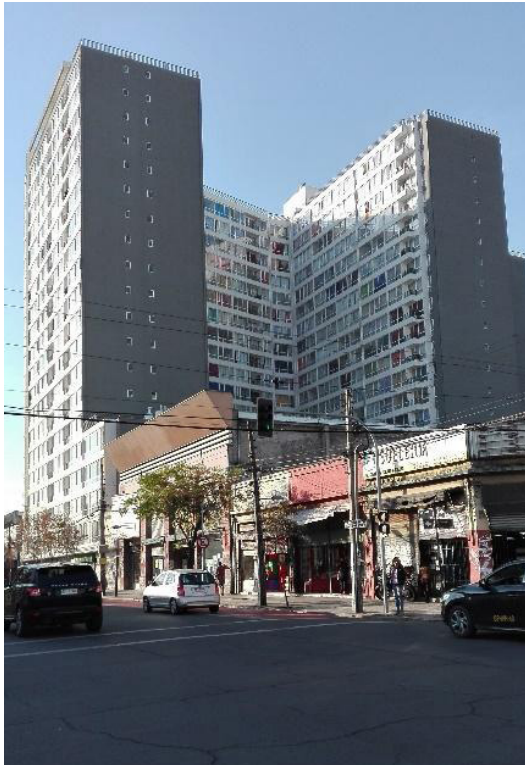
Figura 2 Nuevas edificaciones en pleno barrio Victoria, perspectiva desde calle San Diego