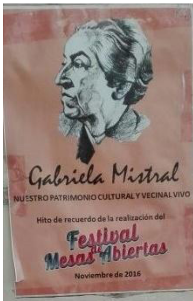
Figura 3 Afiche de un festival tradicional del sector.

Como se puede observar, dentro de estas acciones, destacan distintas formas de apropiación simbólica del espacio, entre ellas, el rescate de tradiciones propias del mundo popular, las cuales, desde la perspectiva de los vecinos organizados, permiten combatir los valores individualistas que promueve la modernización neoliberal. Esto implica la revalorización de determinadas formas de vida consideradas como superiores por parte de los vecinos, los cuales, motivados por los recuerdos, emociones y memorias, sacralizan discursos patrimoniales en base a una revitalización de actividades del pasado en el presente (Figura 3).