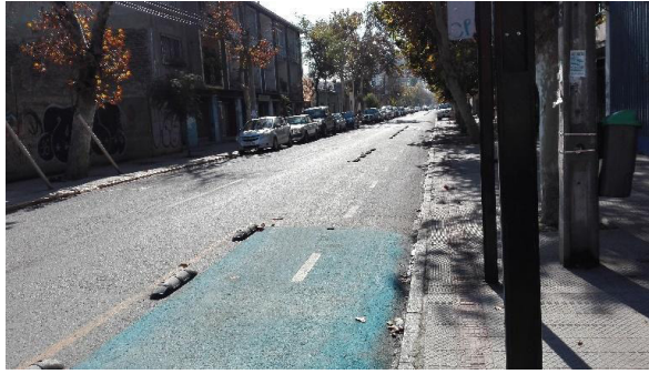
Figura 4 Ciclovías construidas en el barrio, calle Arturo Prat.