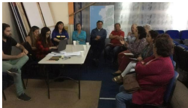
Figura 2. Taller Participativo.

Los talleres participativos, consideraron una metodología basada en principios del grupo de discusión ( Figura 2 ), ya que se buscó construir colectivamente un relato ciudadano, entendido también como una forma de discurso social, mediante el cual aportar al diseño y mejoramiento del espacio urbano desde la mirada de sus protagonistas (Canales, 2006).