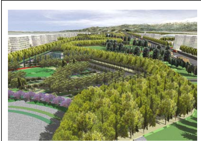
Fig.4. Vista aérea del paseo central arborizado con plátanos orientales.

acerifolia , especie elegida y la disposición de su plantación, creando un largo, y en lugares, ancho paseo; proveerá también protección del viento y sombra a las zonas contiguas.