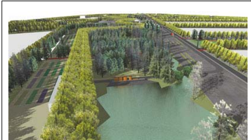
Fig.6.Perspectiva de la laguna.

Por la gran extensión del parque central y materializando los objetivos planteados, se han considerado en su diseño diversos sectores ambientados temáticamente, tales como: la zona de carácter ecológico naturalista, en la que se encuentran la gran laguna; el bosque de coníferas; la hondonada de campamentos y la casa para clubes de práctica de vida natural.