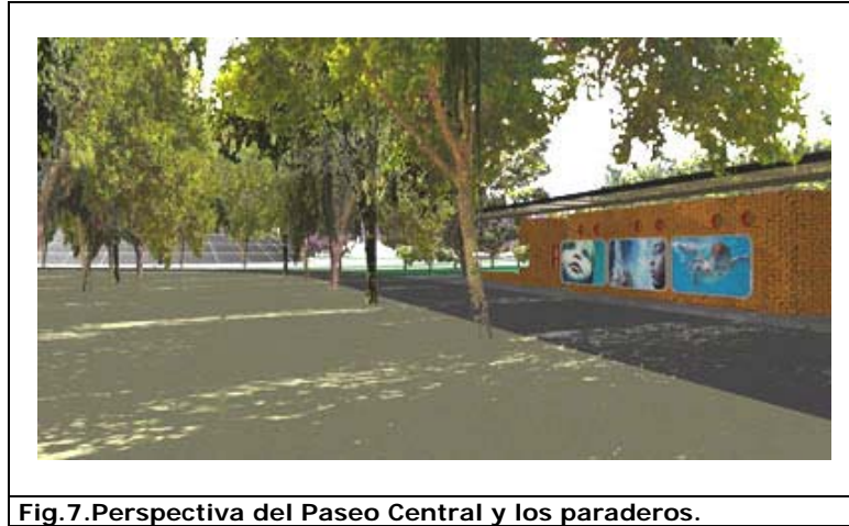
Fig.7.Perspectiva del Paseo Central y los paraderos.

Se han dispuesto también caminos pavimentados que cruzan diagonalmente el parque uniendo los sectores poniente y oriente del conjunto urbano. Estas circulaciones se prolongan en forma armónica e integral sobre los parques laterales y el sistema de vías parque, permitiendo una circulación fluida por un espacio mayor que resultará claramente reconocible por su carácter de ciudad parque.