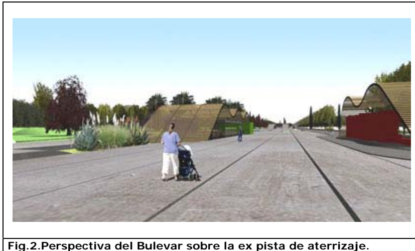
Fig.2.Perspectiva del Bulevar sobre la ex pista de aterrizaje.

El desarrollo del paseo central que recorre el parque completo uniendo las distintas zonas que lo componen se realiza en una plataforma elevada a 60 cm. por sobre las áreas adyacentes, dominando visualmente los espacios colindantes.