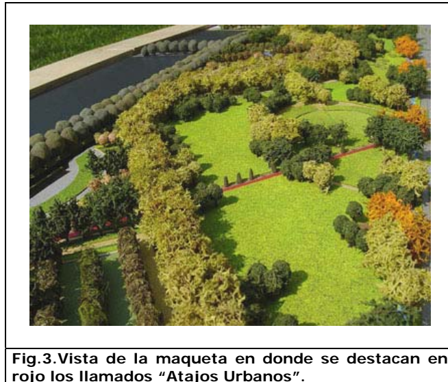
Fig.3.Vista de la maqueta en donde se destacan en rojo los llamados "Atajos Urbanos".

El proyecto quiere lograr un carácter lúdico, imaginativo y recreativo a través de los elementos que conforman el parque, con formas y ritmos en la disposición de sus elementos, con el diseño de sus planos recorribles y en la plantación de las jardineras, con el diseño y la plantación de lomajes y colinas bajas en sectores de las praderas, con el diseño de los caminos interiores curvos o circulares.