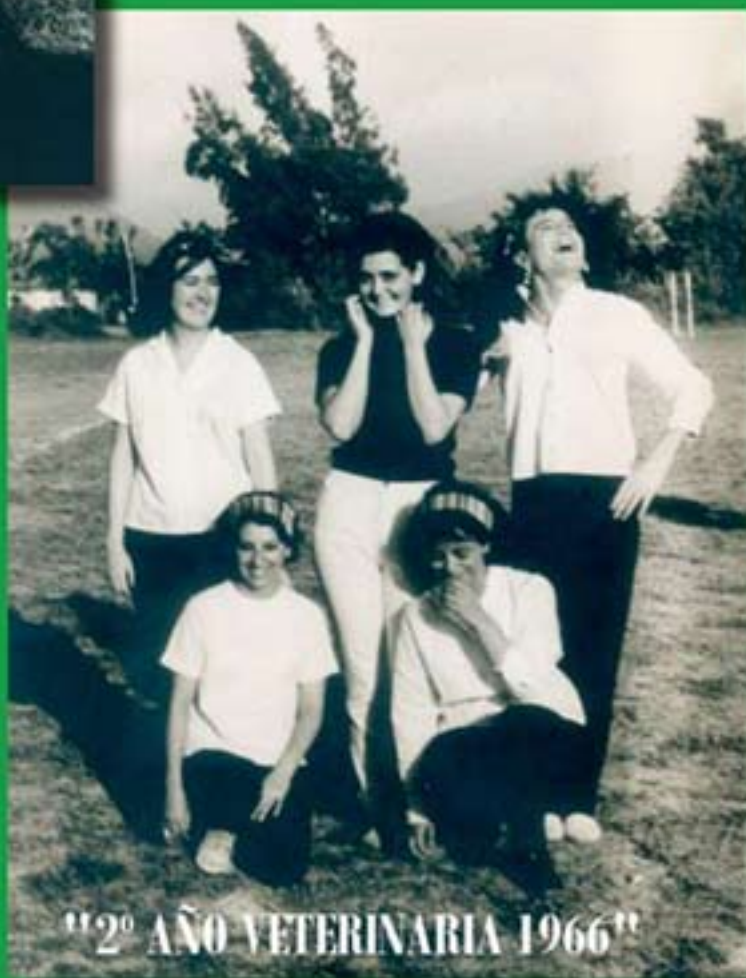
"2º AÑO VETERINARIA 1966"

Hubo una época cuando para una mujer estudiar Medicina Veterinaria era un desafío: era un campo propio de los varones. Pocas jóvenes se atrevían a enfrentar la tradición, tan pocas, que no alcanzaban a conformar un equipo de Babyfútbol, y debían recurrir a "soluciones creativas" para poder completar equipos para las competencias de recepción a los mechones, en el Fundo San Ricardo (Hoy Municipalidad de la Pintana).