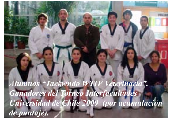
Alumnos "Taekwondo WTIF Veterinaria". Ganadores del Torneo Interfacultades Universidad de Chile 2009 (por acumulación de puntaje).

Los Griegos fueron los padres de los juegos olímpicos, donde aquellos que se enfrentaban en tal justa eran considerados los mejores, elevando su categoría a héroes, verdaderos ejemplos para la sociedad, los mejores, compitiendo por el honor y la