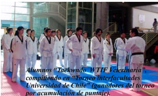
Alumnos "Taekwondo WTIF Veterinaria", compitiendo en "Torneo Interfacultades Universidad de Chile" (ganadores del torneo por acumulación de puntaje).