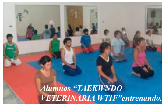
Alumnos “TAEKWONDO VETERINARIA WTIF”entrenando.

En todo sistema que se sostenga en la realidad de formar y educar, de manera integral, con una metodología que apunte a rescatar y potenciar lo más