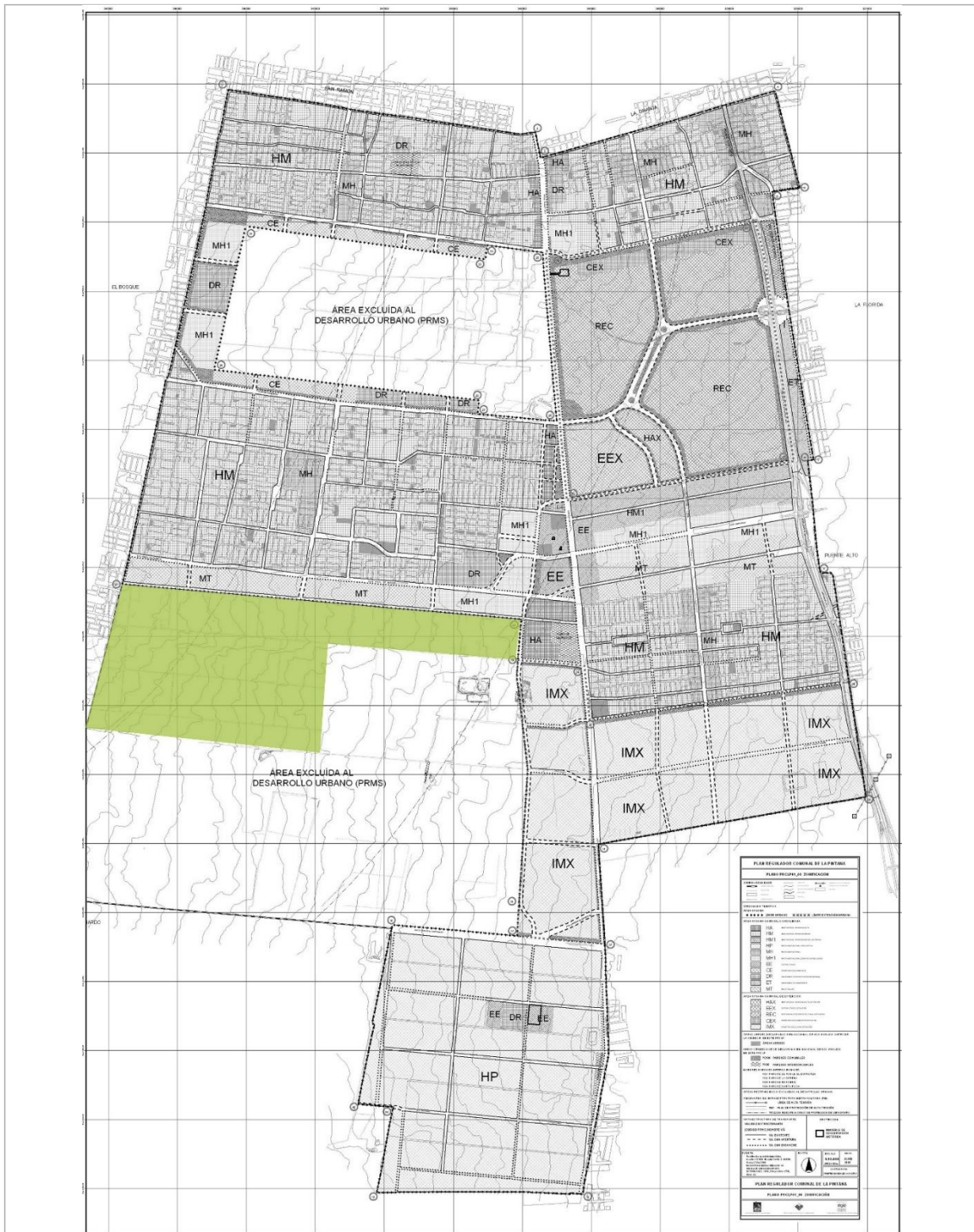
Fig.2.- Proyecto Plan Regulador Comunal La Pintana, 2008.